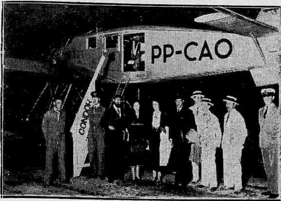
Um aspecto do embarque, hontem, do interventor no Amazonas, que partiu em um avião da Condor

Diversas informações sobre o que ocorre nesta capital e nos Estados